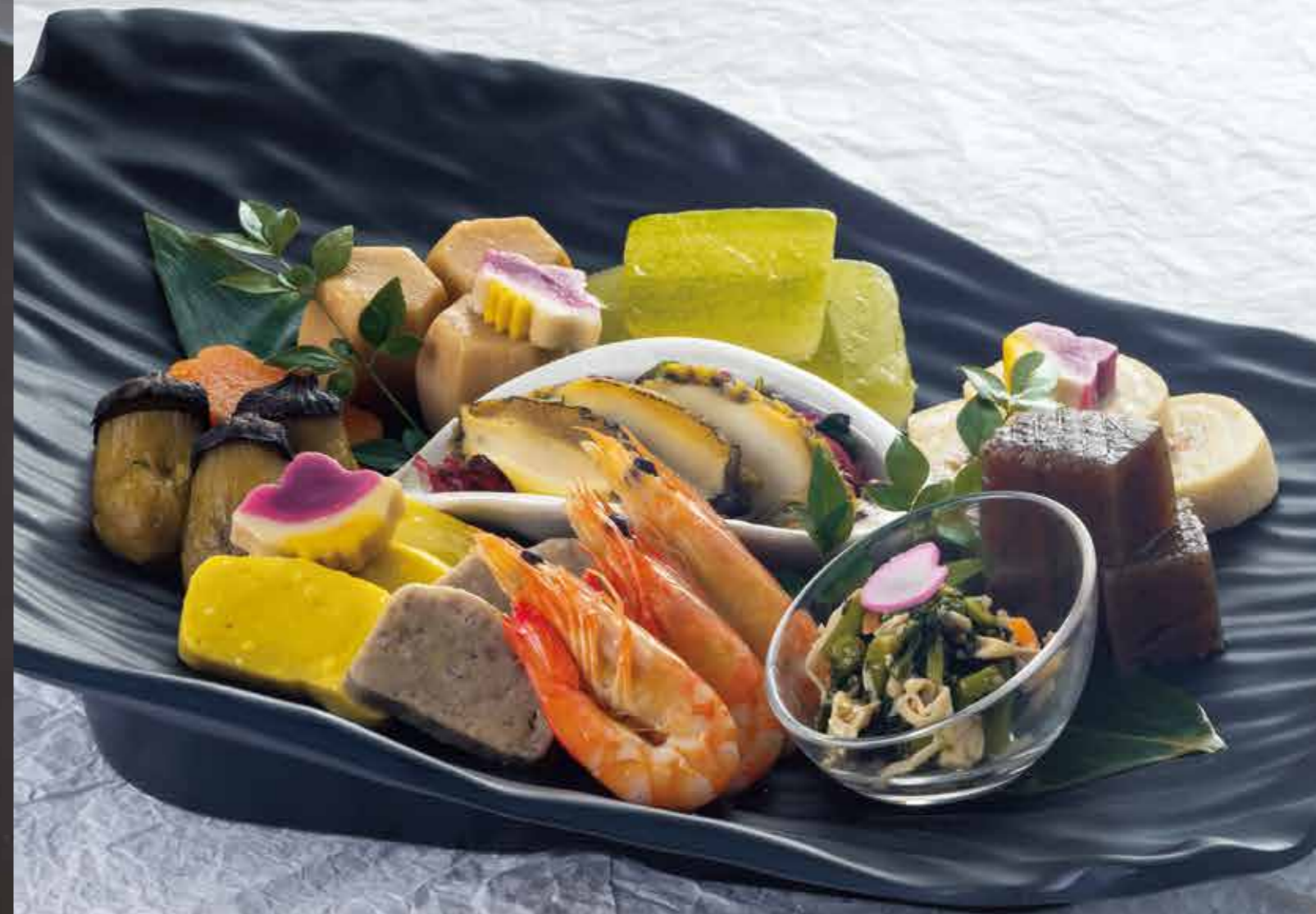
18201 特選煮物 5,700円 (税別)