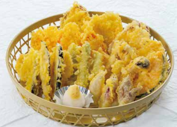
18331 野菜の天ぷら〈3人盛〉 4,200円 (税別)