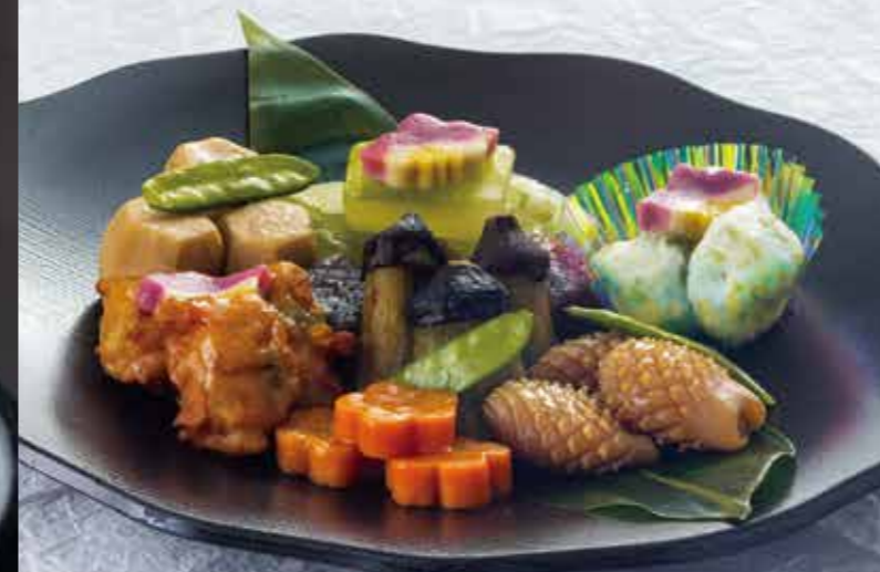
旬の含め煮 18202 〈3人盛〉 3,600円 (税別) 18212 〈5人盛〉 6,000円 (税別)