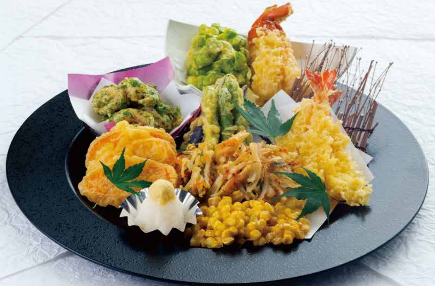
18301 特選天ぷら 8,100円 (税別)