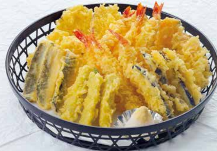
18321 天ぷら〈3人盛〉 6,000円 (税別)